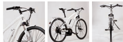
SAMEDI 28 BOSCH NUVINCI