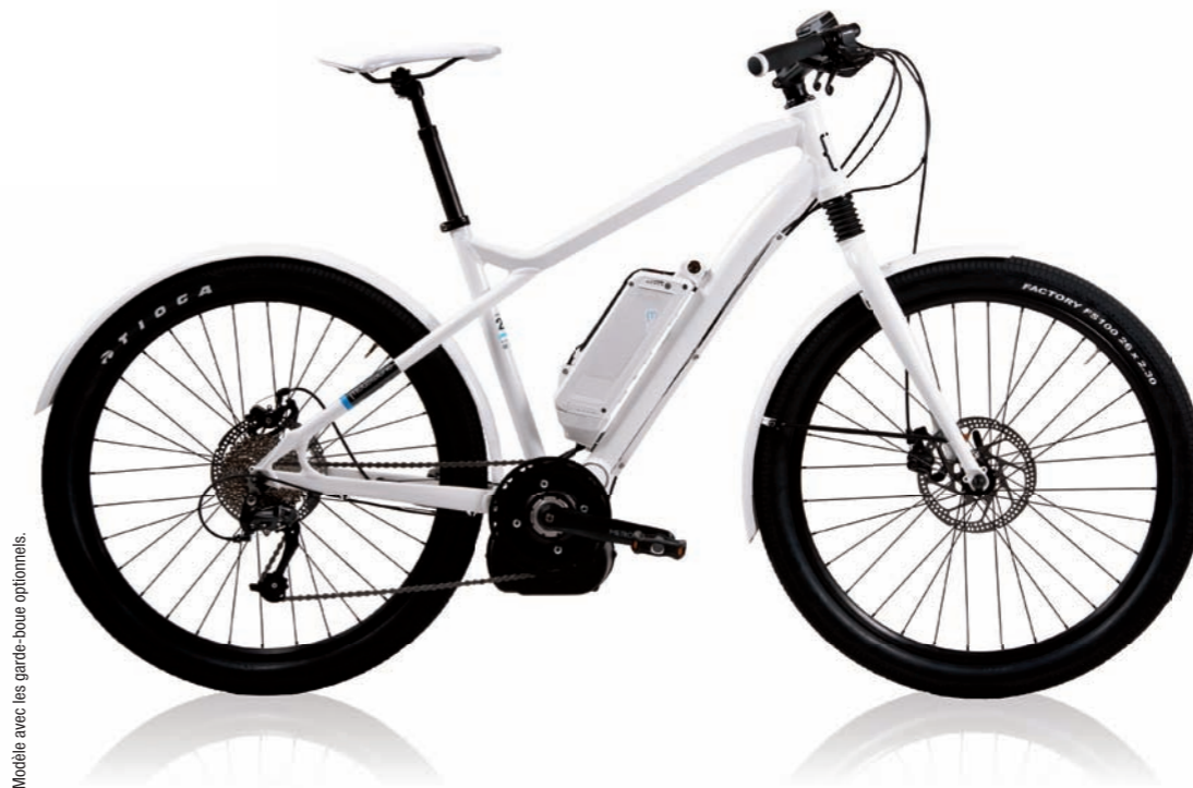
Modèle avec les garde-boue optionnels.