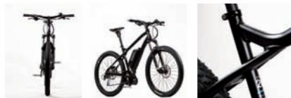
SAMEDI 26 BOSCH 9V