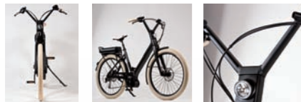
LUNDI 26 BOSCH 9V