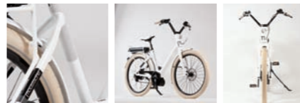
LUNDI 26 BOSCH NUVINCI