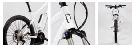
SAMEDI 26 BOSCH 10V