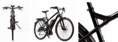
SAMEDI 28 BOSCH 9V