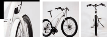
FRIDAY 26 BOSCH 9V